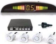
SENSOR DE REVERSA SÚPER BLANCO 089920T000A0