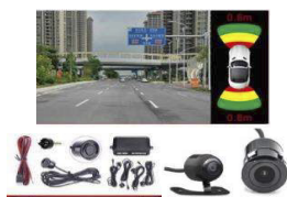
ASISTENTE DE PARQUEO TRASERO Y DELANTERO 0886XVS06B