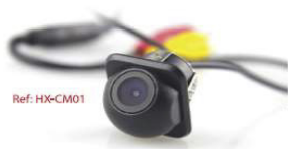
CÁMARA DE REVERSA TIPO GOTERA TODO TIPO 86900CRBC1