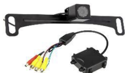
KIT CÁMARA FRONTAL 0886H00M07