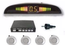
SENSOR DE REVERSA PLATA METÁLICO 089920T001B0