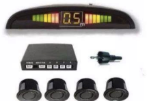
SENSOR DE REVERSA 089920T000