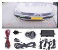
CÁMARA REVERSA CON SENSORES INTEGRADO 86900CRLC1