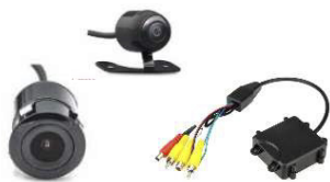
KIT CÁMARA FRONTAL 0886HXCMHX